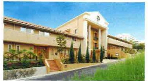
介護付有料老人ホーム「ケアビレッジ千里古江台」パナホーム運営