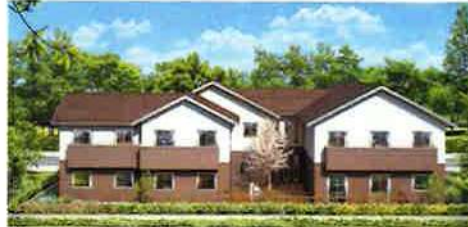
サ高住「パナホーム・ケアビレッジシリーズ」